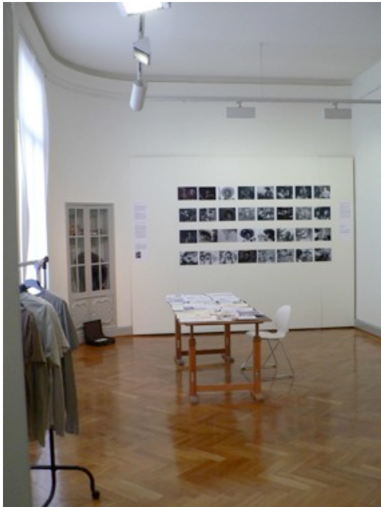
Memorial de Alfonso Bedoya, Villa Dessauer in Bamberg 2008